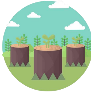
Haşr ve Hesap

3. Hac ve umre ibadeti arasındaki farklara ikişer örnek veriniz. (15 puan)